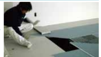
変位吸収部にカバープレートを設置