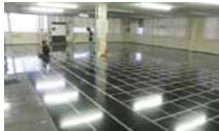
ミュソレーターの敷設