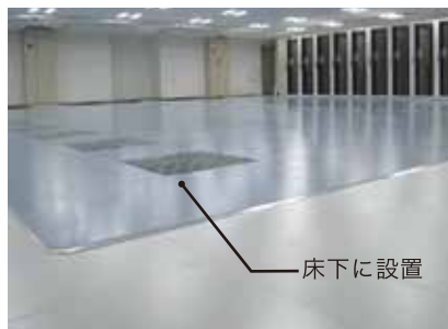
データセンター (大阪府)