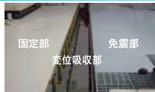
固定部 変位吸収部