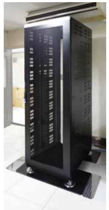
サーバーラック (東京都)