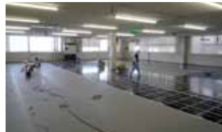
保護シートの施工