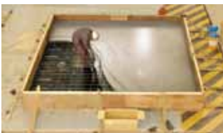
コンクリート層打設