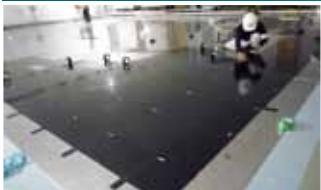
ミュソレーターの施工