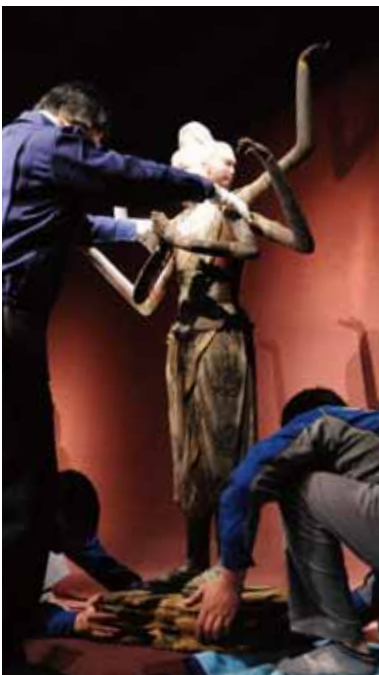
阿修羅像 (奈良・興福寺宝物館)