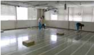
専用両面テープを貼る