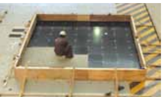
ミュソレーターの敷設