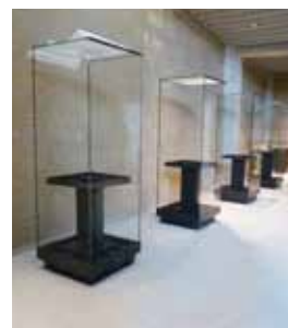
展示ケース (東京都)